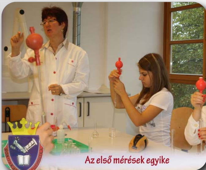
Az első mérések egyike