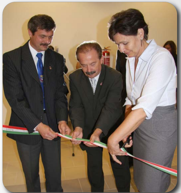
Átvettük a Boronkay új szárnyát