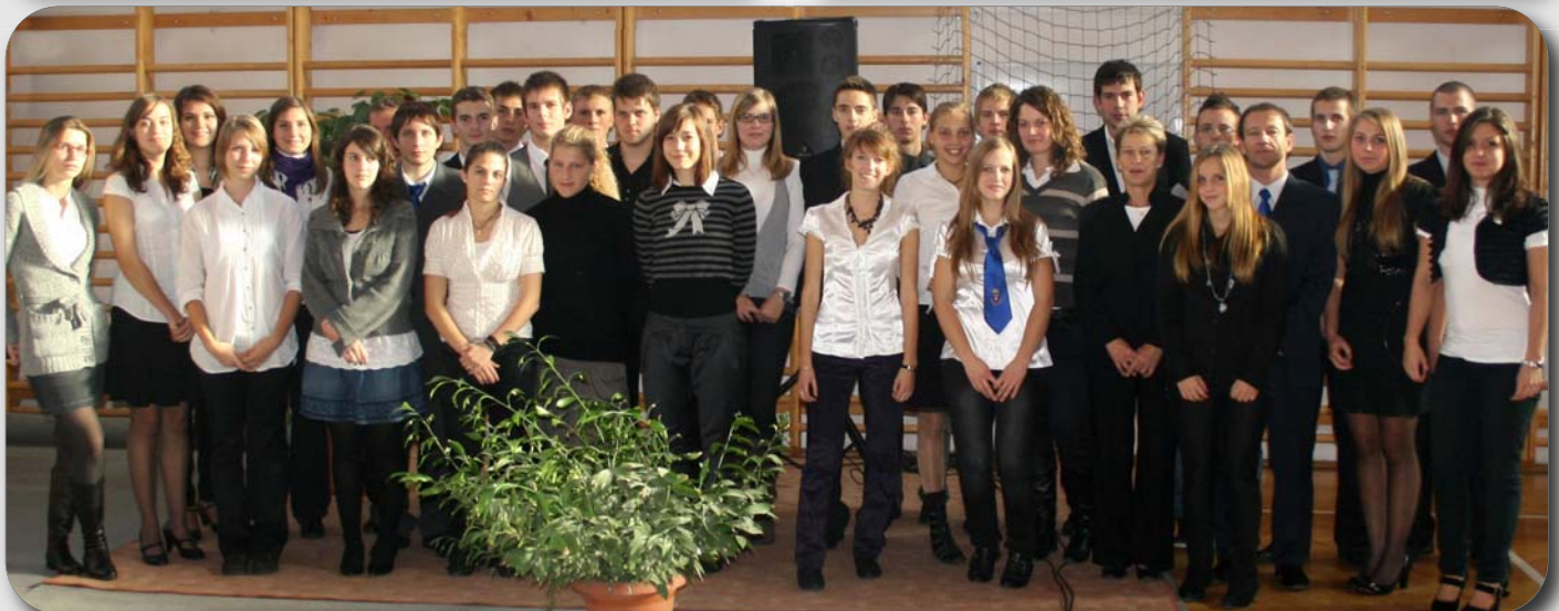
A város száz díjazott középiskolás sportolója közül hatvan fiatal boronkays diák volt