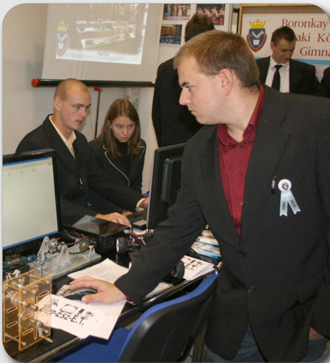
Sikeres volt a pályaválasztási kiállításunk